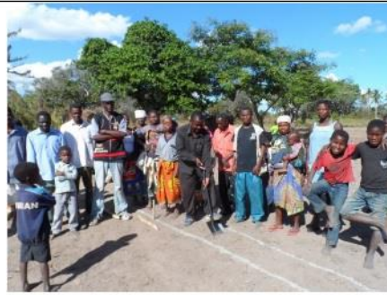
Die eerste sooi word gespit in 2014