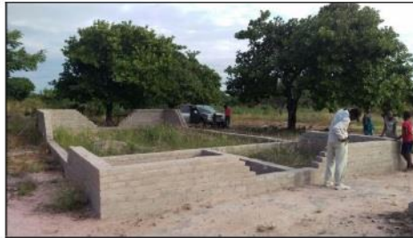
Die bouwerk tot 2017

Verdere fotos van die voltooiing. Let op die blou dak wat ook help om muskiete weg te weer.